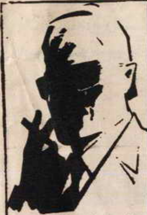
رقم صفر الزعيم القامض الذي لا يعرف حقيقته احد ..