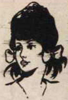
رقم ٤ - هدى من القرب