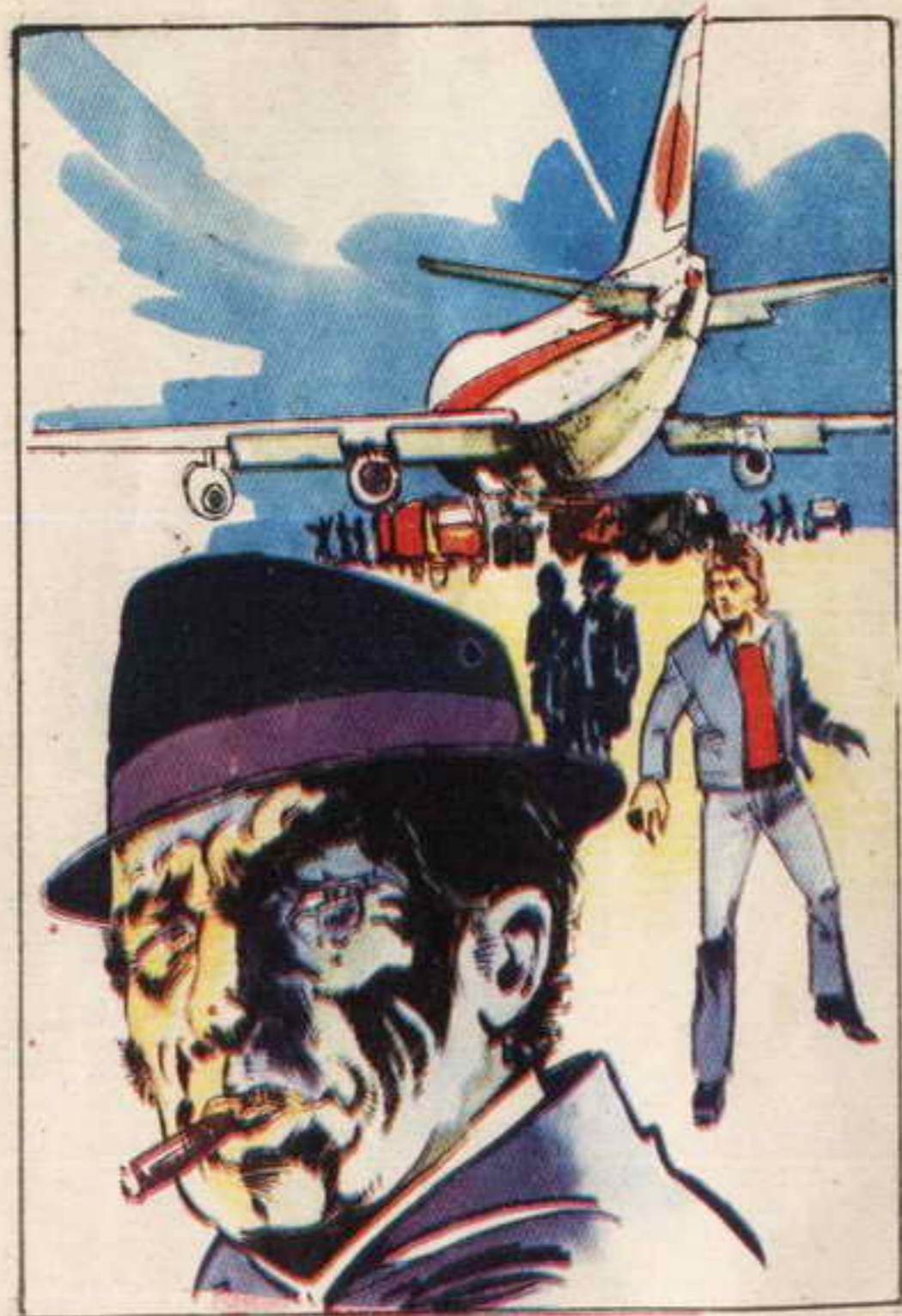
عندما هبطت الطائرة في مطار سنغافورة ، نزل أحمد بعد إلهام ، ولاحظ أن الرجل ذا السيجار الأسود يتبعها .

جزيرة « سنغافورة » ، فأبلغنا قائد الطائرة أن يهبط فوراً لتفتيش الطائرة ، وقد صعد إليها الآن خبراء المفرقات .. رغم أهمية هذه المعلومات لـ « أحمد » إلا أنها أضاعت منه لحظات ثمينة غفل فيها عن مراقبة « الهام » ، فعندما التفت بعد انتهاء حديثه مع رجل الشرطة كانت « الهام » قد اختفت عن عينيه .. وأحس بأعصابه تتوتر ، وأخذ يسير مسرعا متنقلا بين أبهاء المطار الضخم باحثا عنها .. ولكن دون جدوى ..