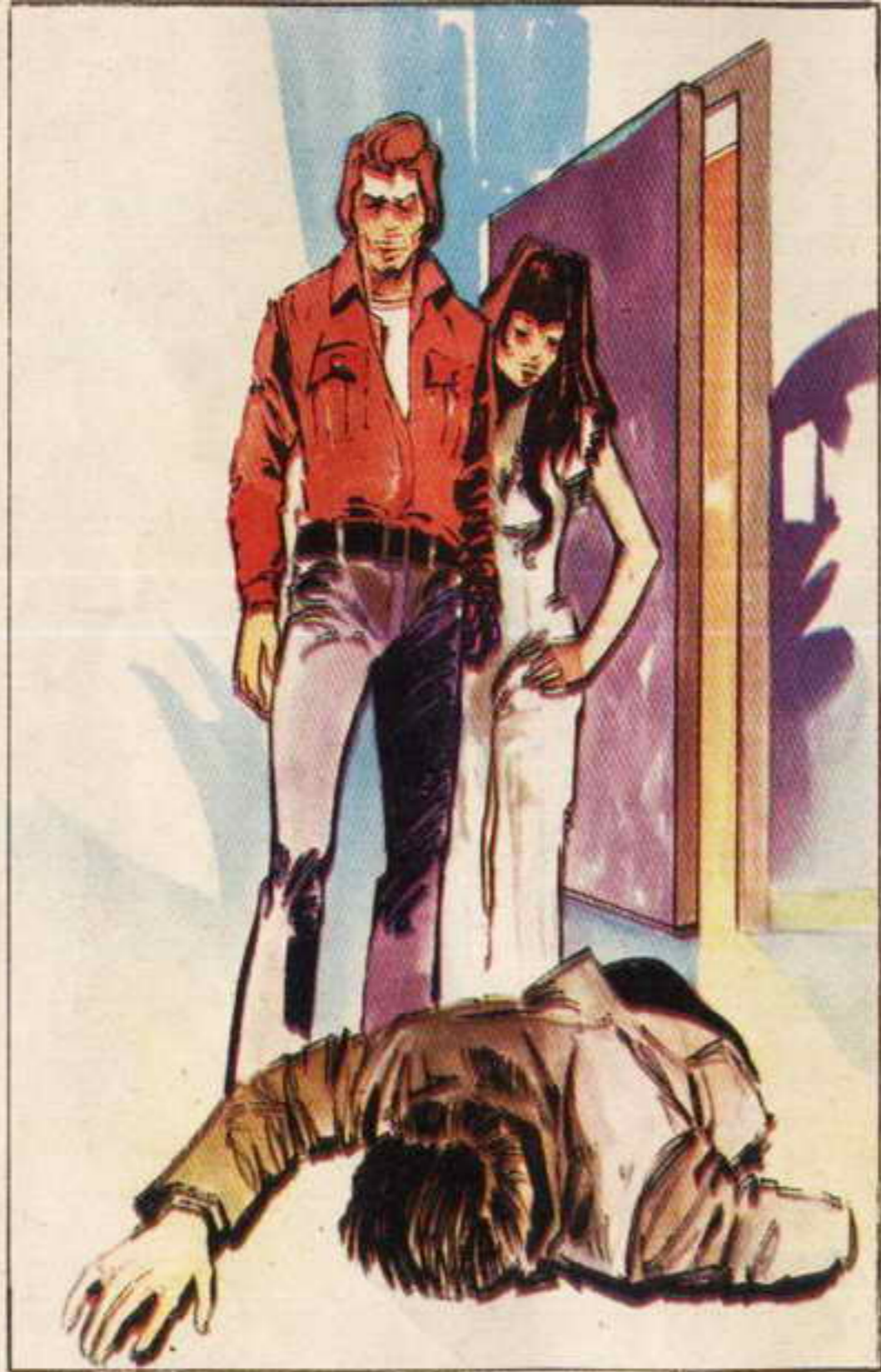
ظهر "أحمد" على الباب ، ودون كلمة أزاح الجسد المستلق على الأرض داخل الغرفة وأسرعت "إلهام" تساعده .

ورأت على الضوء الخفيف أن هناك من يحاول فتح الباب .. وأدارت قرص التليفون على رقم (٢) ثلاث مرات ، وسمعت الجرس الخفيف في الجانب الآخر ، ومرت ثوان والتليفون يدق دون أن يجيب أحد .. وأدركت أن « أحمد » ليس في فراشه .. فكل الشياطين متعودون على أن يستيقظوا عند أي حركة بالقرب منهم .. انهم يستشعرون الخطر وهم نائمون ..