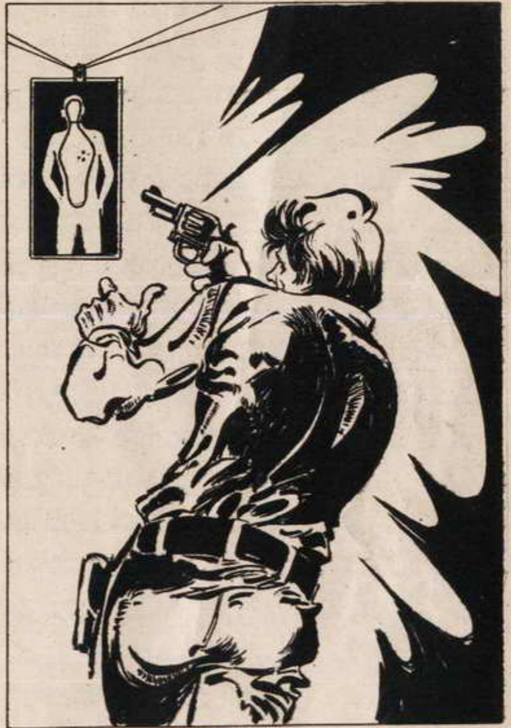
اختار أحد أن يضرب مفتوح العينين على أهداف سريعة تتظهر لشانية واحدة ثم تختفي .

ولم يتسع الوقت للشياطين إلا لنظرات سريعة تبادلوها ، ثم اختفوا جميعا وراء الأبواب الخفية التي تملأ المكان .. أبواب أوتوماتيكية تفتح في نفس لحظة الاضاءة في إشارات الإنداز ثم تغلق بعد خمس ثوان بالضبط .. وكان كل واحد من الشياطين الـ ١٣ يحفظ بالضبط المكان الذي يمر منه .. وفي لحظات كانوا قد اختفوا جميعا ، وكل منهم يسأل نفسه عما حدث ، ونوع الخطر الذي يتعرض له المقر