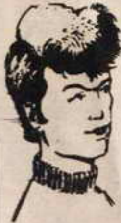
رقم ٦ - مصباح من ليبيا