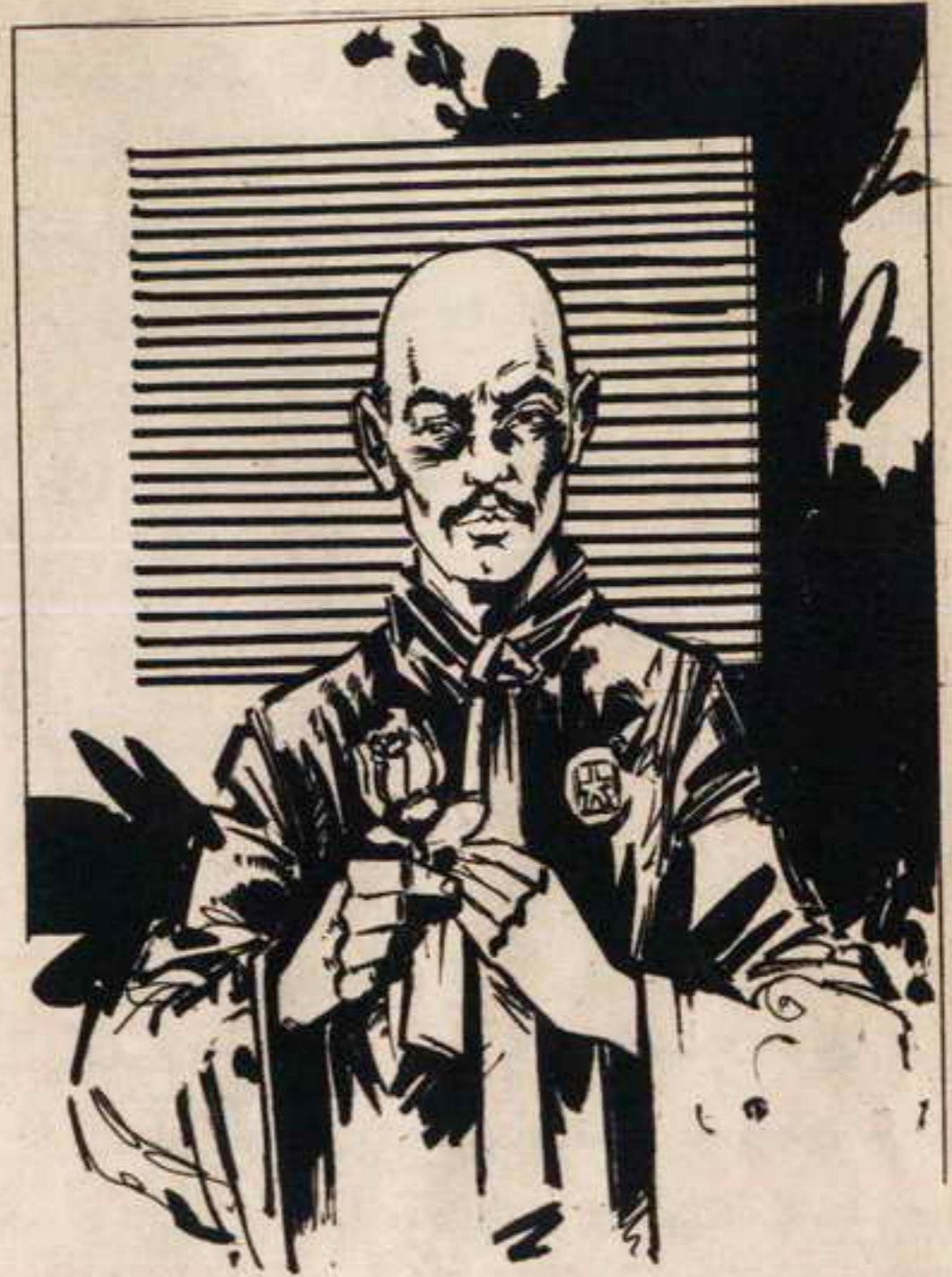
كان رجلاً في حدود الخامسة والخمسين من عمره ، شديد الأناقة ، ويضع في عذوة جاكته وردة حمراء.

وأمسك بالوردة لحظات يتأملها وقد رسمت على شفثيه ابتسامة انتصار ، ثم قال : « والوردة التي خطفت منك؟ » ردت الهام : « لقد كانت وردة مزيفة .. » الرجل : « لقد توقعنا هذا ، فلم نظارد الرجل » الهام : « لقد تعرضت لمضايقات أخرى في سنغافورة .. » الرجل : « لقد عرفنا كل شيء ، ولكن بعد فوات الأوان على كل حال لن يستغرق الأمر سوى لحظات قليلة .. » فتح الرجل الوردة ، وأخرج الميكروفيلم الصغير ، وأمسكه بين أصابعه لحظات ثم دق جرسا وعلى الفور ظهر رجل عند الباب ، وقال الرجل الأنيق : « خذ هذا الى « ويب » أريد أن يقول لنا رأيه في دقائق .. » أشار الرجل الى « الهام » أن تجلس ، وسرعان ما دخلت عربة الشاي تدفعها فتاة جميلة ، قامت بسرعة واتقان بتقديم فنجان الشاي الى « الهام » انتى كانت في حاجة اليه .. عاد الرجل الى النافذة يتأمل المشهد الطبيعي .. ومرت الدقائق ثقيلة ، ثم سمعت الباب يفتح ، ودق قلبها سريعا ، والتفت الرجل الأنيق .. وسمعت « الهام » الرجل الذي