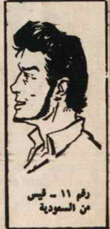
رقم ١١ - فليس من السعودية