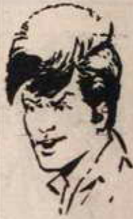
رقم ٥ - بوعصب من الجزائر