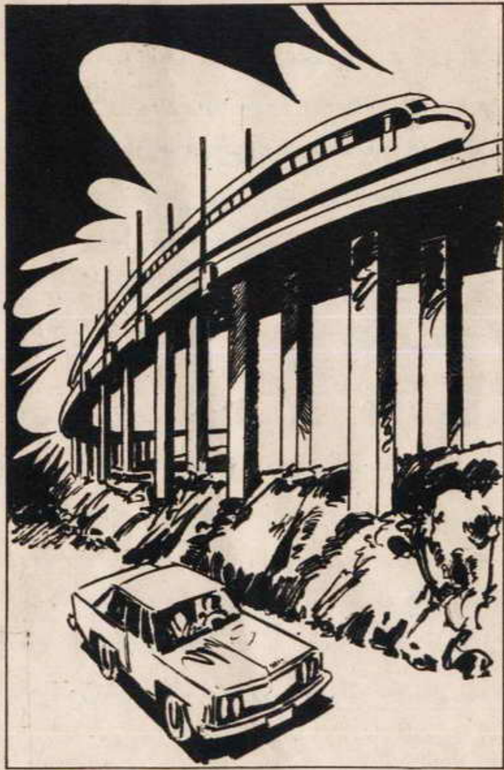
ومضى القطار السوبر إكسبريس الذم يشبه الصاروخ يشق طريقه على قضيب واحد في وسطه ، بسرعة عالية ، دون أن يهتز .