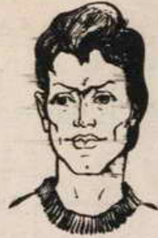
الـرـعـبـي فـنـي سـنـتـشـوزا

عندما أنزلت الطائرة عجلاتها وجرت على مطار « سنغافورة » الدولي .. لاحظ « أحمد » على الفور أن ثمة إجراءات أمن وإسعاف كبيرة تجرى على أرض المطار ، واستطاع أن يلمح أكثر من خمس سيارات إطفاء ومثلها للإسعاف ، واستنتج على الفور أن الطائرة معرضة لانفجار .. وربط بين هذه الإجراءات وابتسامة الرجل ذي السيجار الأسود .. نعم هكذا فكر « أحمد » ، هناك أشياء تجرى في الخفاء .