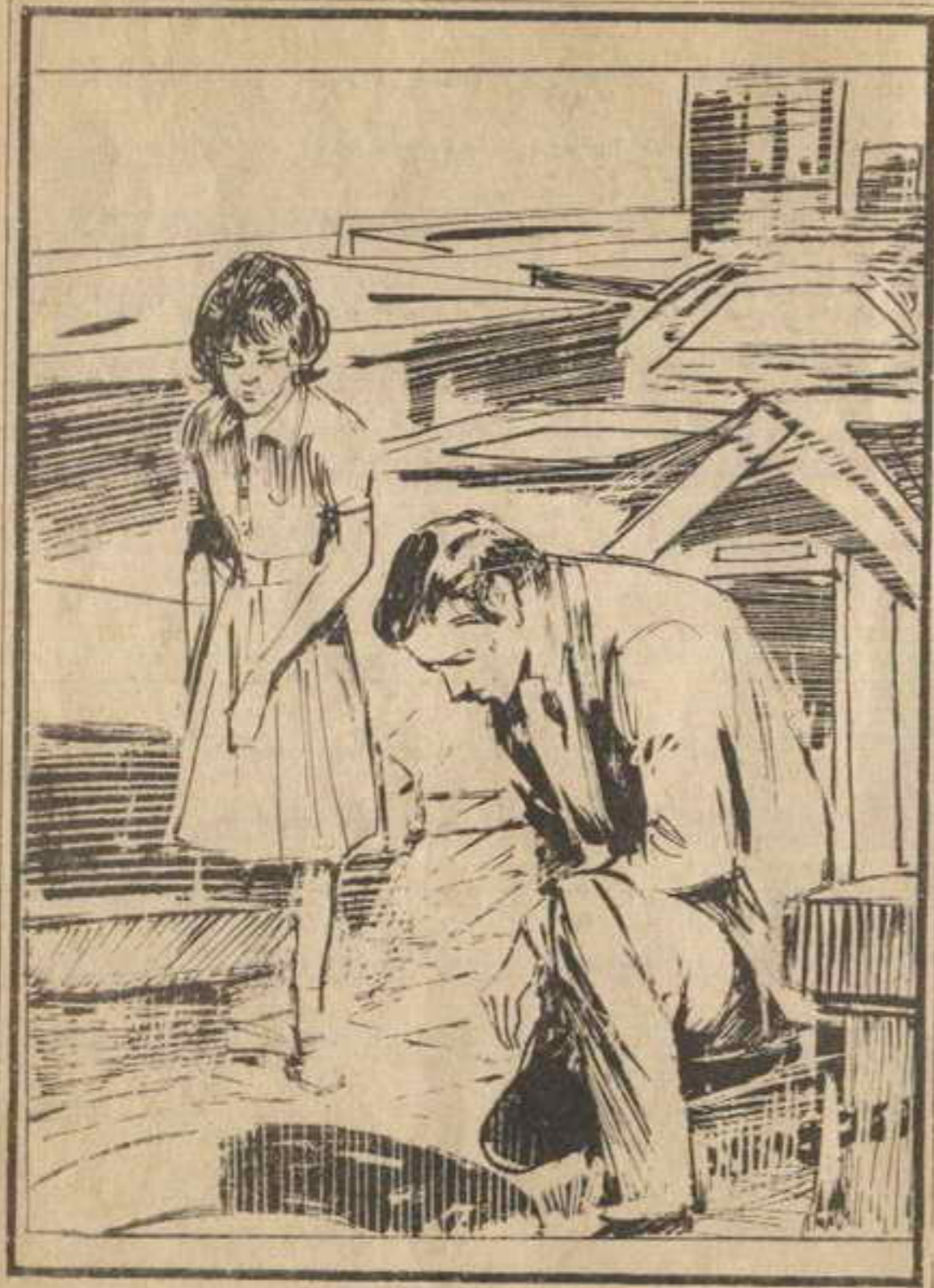
قالت « قفل » إذن فقد جاء اللص وصعد السلم الحديدية ..

خاصة وأنه يحمل معه التاج الذهبى .. ثم هبطا بواسطة السلم الحديدى ثانية وعادا إلى داخل المعرض . قال العقيد « محمد » مشيراً لأحد مساعديه : استدع الحراس المسئولين عن حراسة المعرض فى الليلة السابقة .. وبعد دقائق جاء الحراس الذين كان قد تم استدعاؤهم من منازلهم فور اكتشاف السرقة .. وجه العقيد « محمد » سؤاله الأول لمسئول الأمن فى المعرض قائلاً :