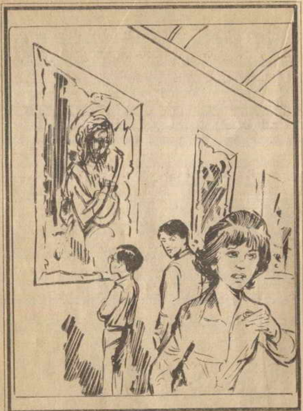
وفجأة تنبهت « فلفل » وقالت : أين مشيرة ؟

ويتأملونها بشدة .. وفجأة تنبهت « فلفل » وقالت : أين « مشيرة » ؟ وعلى الفور تنبه « خالد » و « طارق » ، وأخذوا ينظرون حولهم في دهشة ، فقد كانت « مشيرة » بجوارهم منذ لحظات ..