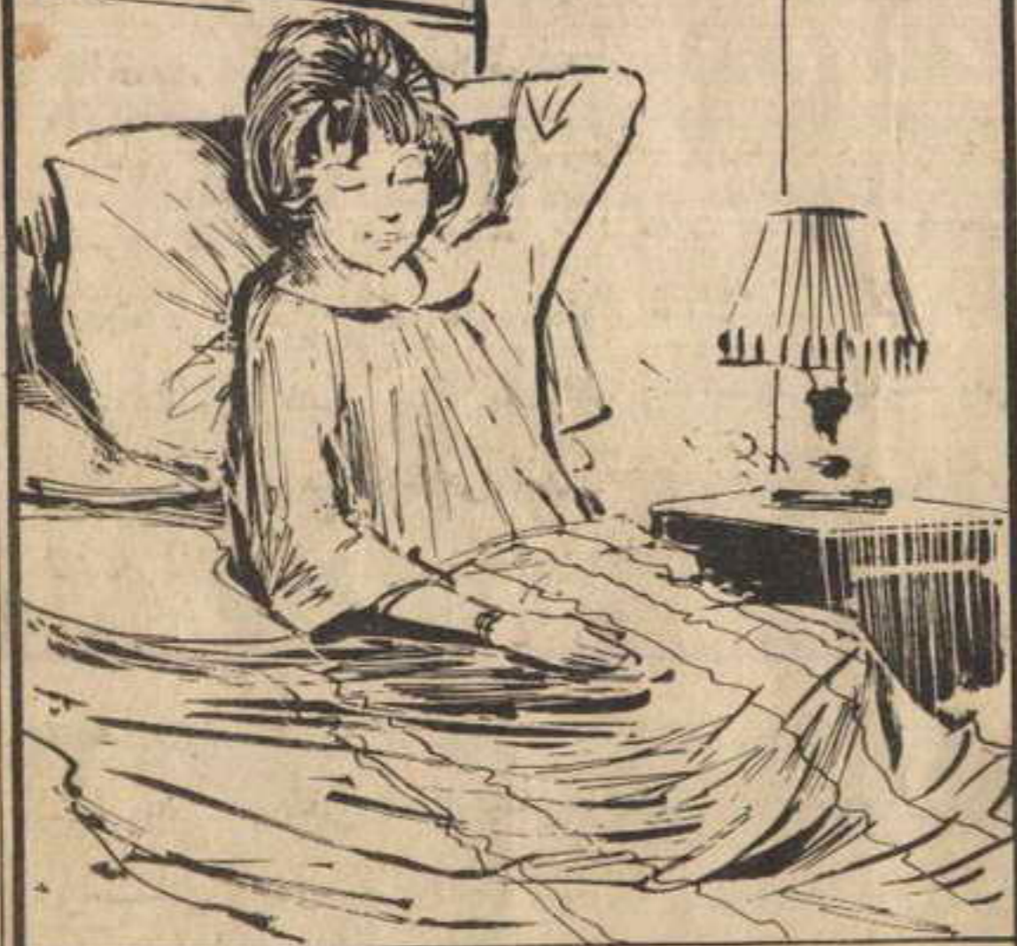
استلقت « فلفل » فوق سريرها تسترجع أحداث اليوم المشير ..

وتأتى أهم نقطة في اللغز ؛ وهي كيف استطاع اللصوص الخروج بالتاج من المعرض .. فإن خرج عن طريق