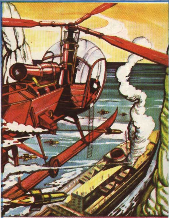
اقتربت الطائرة أكثر وأكثر وفي لحظات خاطفة أسقطت مجموعة كبيرة جداً من القنابل الصغيرة المسيلة للدموع . .

كانت الصورة صغيرة ، ولكنها واضحة . . بها الطائرة الهليكوبتر ينزل منها مقعد معلق عليه رجل في يده كمامة . .