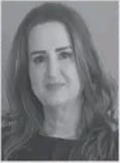
بقلم: سرود عثمان مصطفى د. محمد فتحي عبد العال

كخجي فكان عليه مصارعها نركا لها الإختيار. اغتارت خجي الحب والانتصار له مهما كانت الصعاب التي تنتظرها ما ضجع سيامند أن يكون حوجوه بخجي على مرأى ومسمع من الخبيج وليس هويها في جوف الليل بل إعلاناً واشتهاراً لشيءها فالف ليس عيباً أو جرماً يخفيه ويكتمه