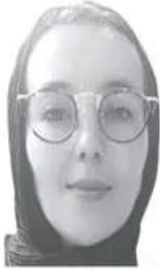
بقلم: نوال بلحسين

ضعيف أو نشرة جبل دعواني لتسبح علما ناناك الاستقلال الذي وصلته الاستقلال المبكر حتى لا تكون تابعة لروح ولا لغة ولا خصاصة تيرجيجها خلاصة استشارة لآرم إعادة تربية وتاهيل الأتات لعرفة حروفهن وثريته وتاهيل الذكر لعرفة حروفهن