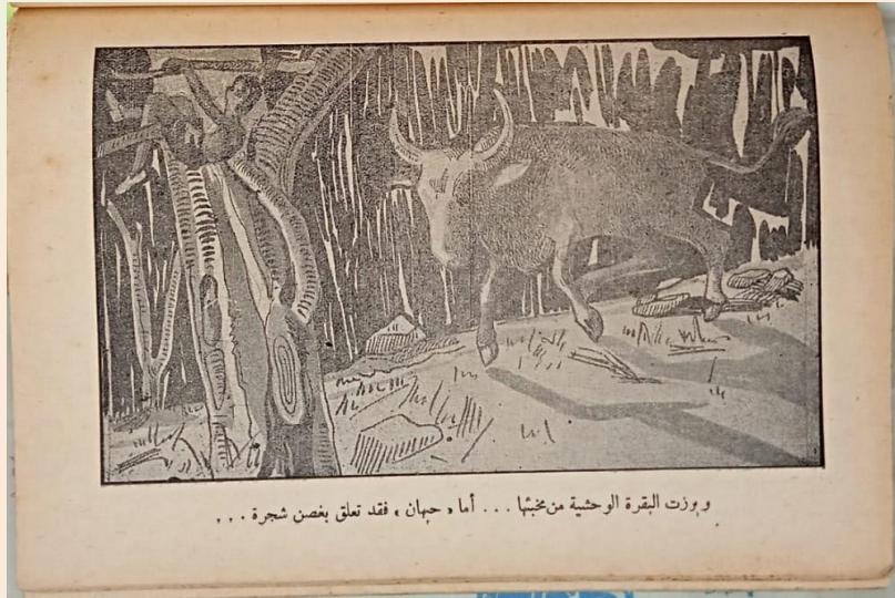
ووزت البقرة الوحشية من مخبئها .. .. أما دهبان ، فقد تعلق بغصن شجرة .. ..

الهلاك ؛ فقد كان الصيادون تحت مهب الريح ؛ فطأ رأسه و هو يخور بصوت عميق ؛ فتجمع القطيع كله حوله مرة أخرى ؛ و أكب يرعى ثانية هنا و هناك ؛ يقتلع الحشائش الكثيفة بأشداقه القوية ؛ و يطحنها بأسنانه التي هي كالحجارة صلاباً .. .. فتسلل الصيادون خلف البقرة الهاربة التي جرحها أبو مرجان برصاصته ؛ مهتدين بنقط من الدم تساقطت من جرحها على الأرض ؛ و لم يمشوا طويلاً حتى الفوا انفسهم فجأة وجهاً لوجه مع البقرة الوحشية الجريئة ؛ و كانت قد اختبأت منهم بجنب و دهاء خلف شجرتين تتعاق غصونهما و تتشابك .. فلما شمت البقرة رائحتهم التفتت و رأهم ؛ فبرزت من مخبئها غاضبة غضبا جنونيا و رأسها مستعد للهجوم ؛ و قرناها الحدان مسرعان ؛ و ذيلها مرفوع في ثورة كأنه سوط ستهوي عليهم به ..